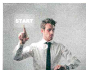
FASE 3: PIANIFICAZIONE

La progettazione globale e la progettazione esecutiva sono garantite dalle competenze specifiche sia tecniche che disciplinari .