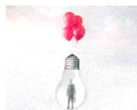
FASE 4: ESECUZIONE

La redazione di un dettagliato diagramma dei lavori per avere sempre sotto controllo i tempi e le metodologie di realizzazione delle varie fasi di lavoro.