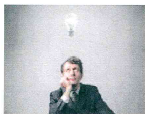
FASE 1: ANALISI

Il nostro lavoro inizia con la raccolta e l'attenta analisi delle necessità del cliente al fine di tradurle pienamente i bisogni in soluzioni fattibili.