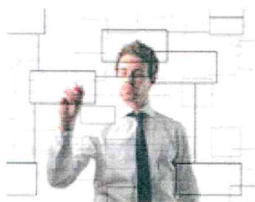
FASE 2: PROGETTAZIONE

Il nostro lavoro inizia con la raccolta e l'attenta analisi delle necessità del cliente al fine di tradurle pienamente i bisogni in soluzioni fattibili.