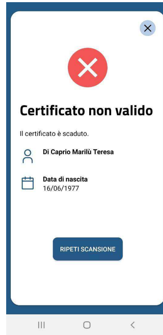
App VerificaC19 Certificato scaduto