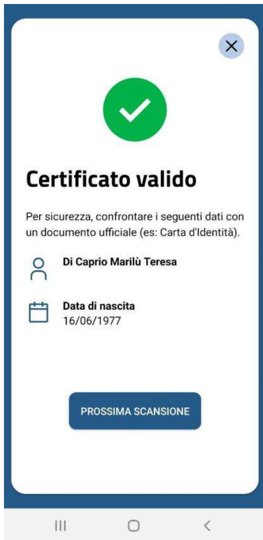
App VerificaC19 Conferma di certificato valido