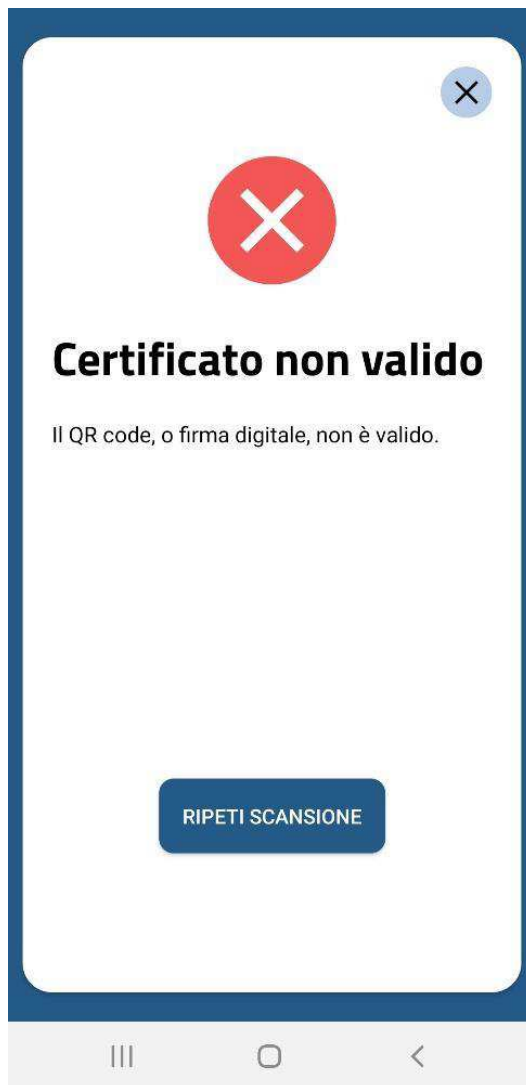
App VerificaC19 Certificato non valido