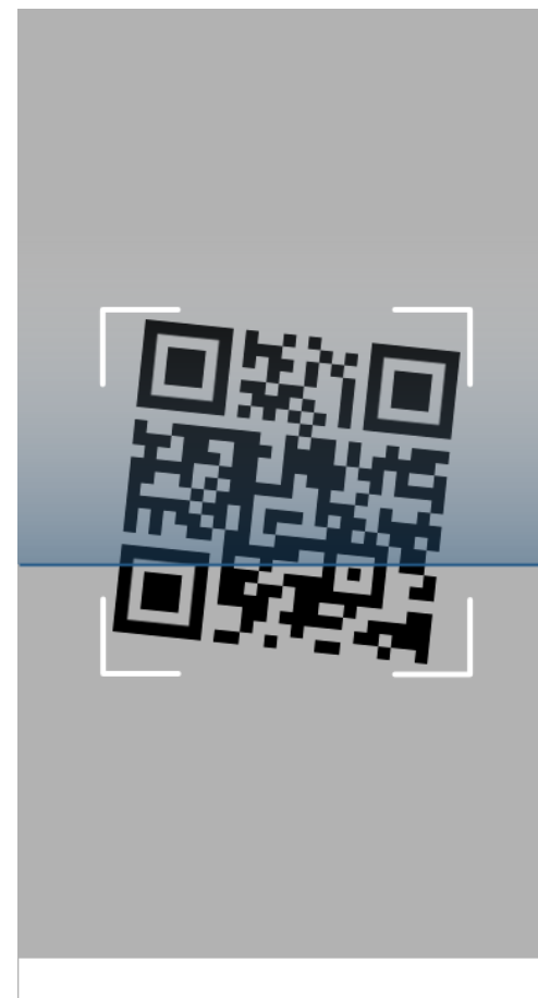
App VerificaC19 Scansione di un QR code